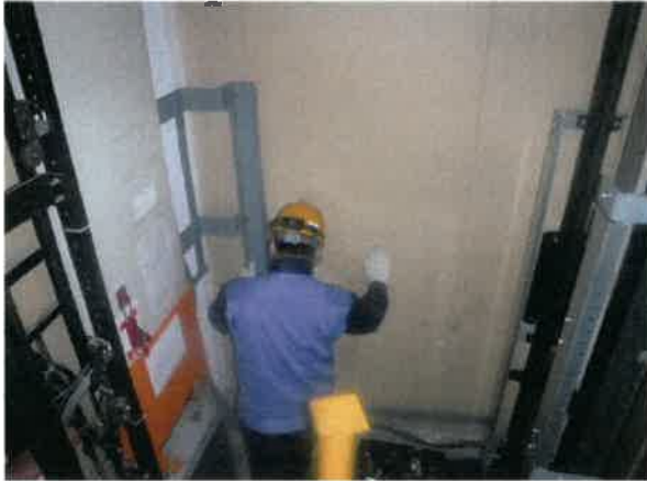
(1) 戸開走行保護装置制御盤 取付前 取付後