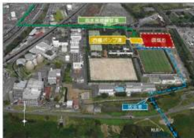
[洛西浄化センター航空写真]