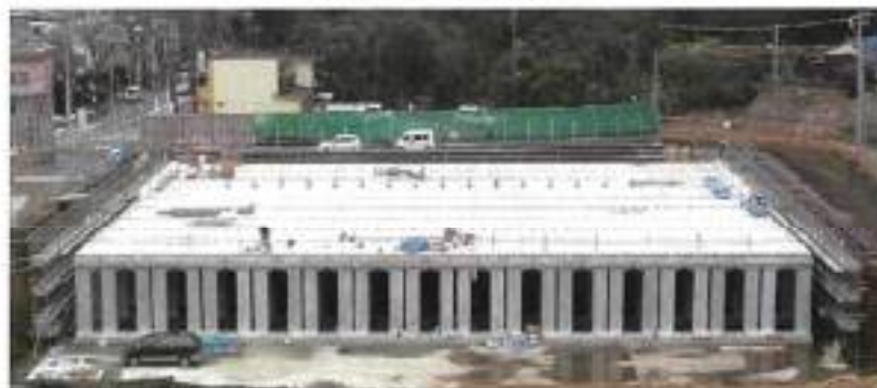
[プレキャストブロック部完成イメージ]