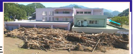
平成28年台風10号により、岩手県の要配慮者利用施設では利用者9名の全員が死亡。