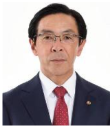
京都府知事 西脇 隆俊