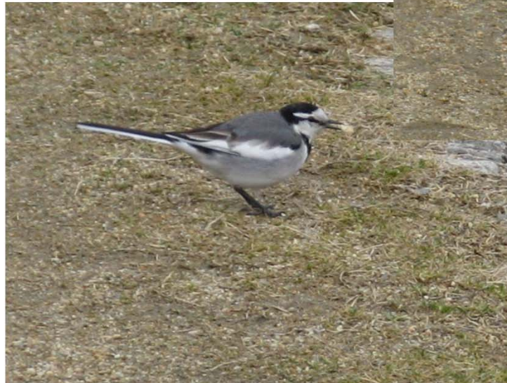
枯れた草や石の上は保護色に