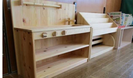
・宇治田原町 保育所への木製品導入