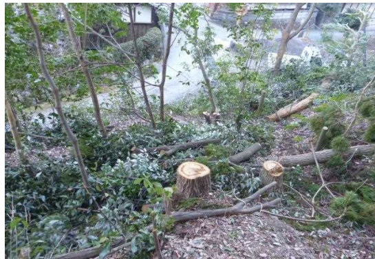
・精華町 公道・住宅沿いの危険木伐採