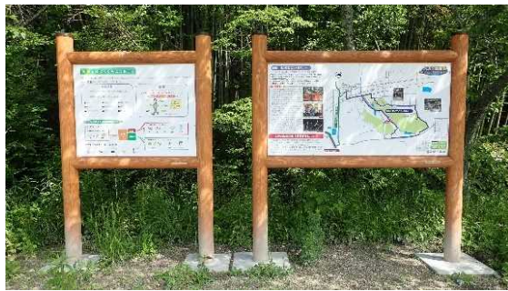
・京田辺市 散策路の案内板を設置