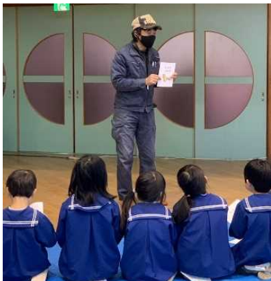
木を使う大切さを絵本で説明