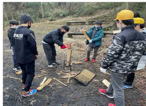
・精華町 森林環境教育