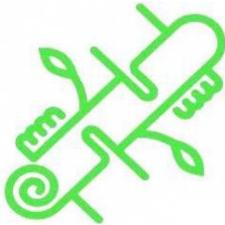
京都府内産木材認証制度標章