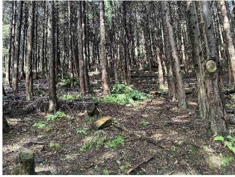
・笠置町 高齢級人工林の間伐