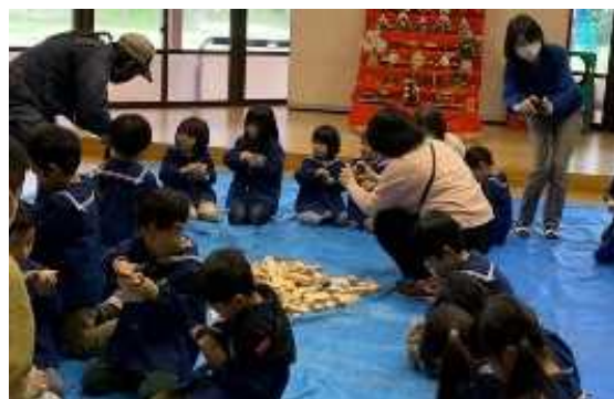
京都府内産木材をやすりで削り、つみきを制作