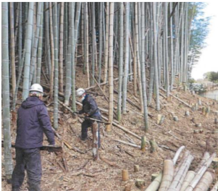
・城陽市 市有林の竹林伐採