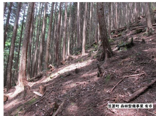
笠置町 森林整備事業 有市