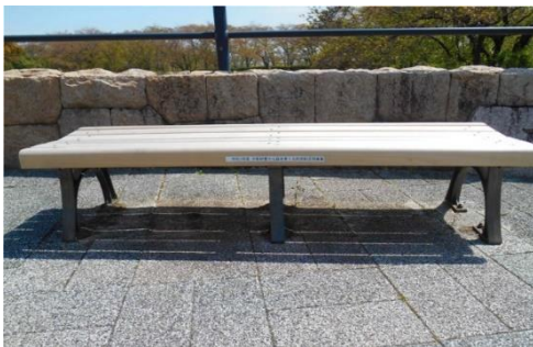
・八幡市 公園への木製ベンチ挿入