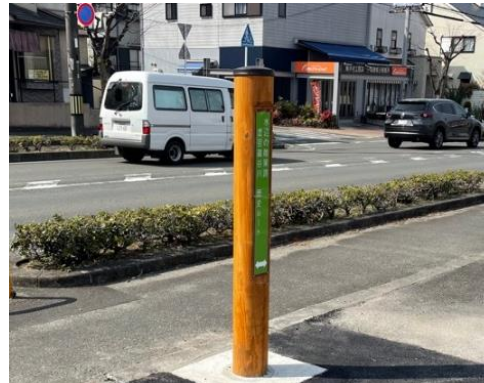
・京田辺市 散策路の案内板を設置