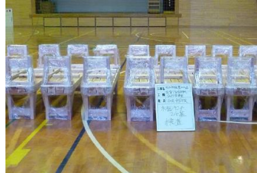
・和束町 中学校への木製品導入