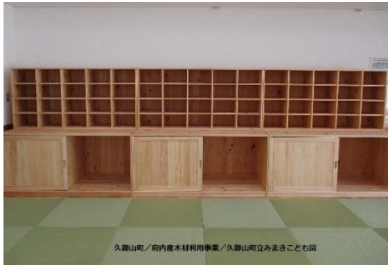
・久御山町 保育園への木製品導入