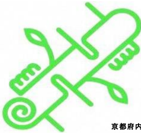
京都府内産木材認証制度標章

豊かな森を育てる府民税ホームページ https://www.pref.kyoto.jp/shinrinhozen/tax.html