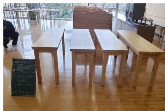
・南山城村 小学校への木製品導入