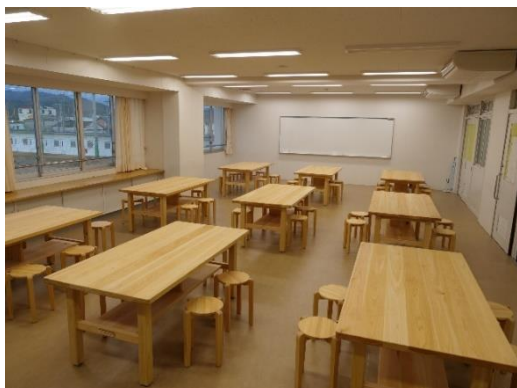
・木津川市 中学校への木製品導入