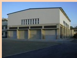
屋内訓練場の外観

京都府立消防学校で、府内消防職員・団員の教育訓練機能の充実を図るため整備していた「屋内訓練場」が平成25年10月8日(火)竣工しました。雨天時においても車両を使用した訓練やロープ渡過等の救助訓練が可能となりました。