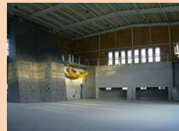
屋内訓練場の内観

併せて、府中北部の消防団員等の訓練の利便性等を図るため、福知山市と連携し、「福知山市消防防災センター」に「京都府立消防学校北部訓練拠点」を設置することとし、10月24日(木)に開設式を行いました。