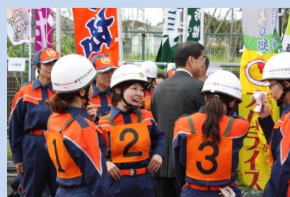
互いの健闘を讃えあう団員達