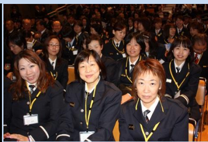
参加された女性団員の皆様