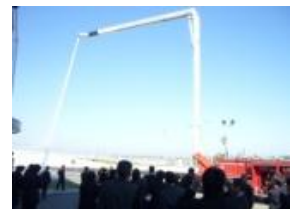
《「関西空港消防所」視察の様子》