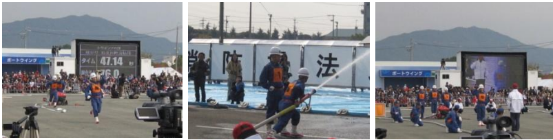
《宮津市消防団出場の小型ポンプ操法の模様》