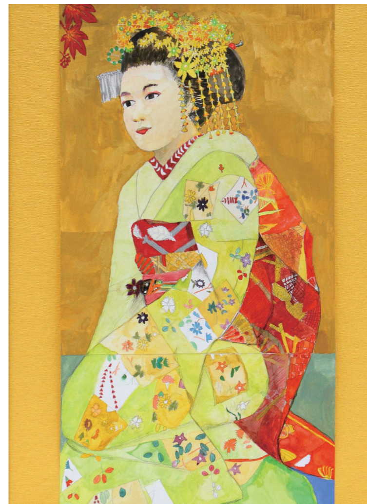
令和3年度 絵画の部 京都市長賞「秋の京舞妓」Shiyouko

※芸術・文化を通じて共生社会や多様性について考える取組「CONNECT(コネクト)」[主催:文化庁・京都国立近代美術館]と連携しています。 2022年12月1日(木)~12月18日(日)(予定) https://connect-art.jp (2021年度CONNECT公式ウェブサイト)