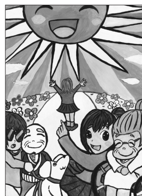
高校生・一般部門 優秀賞 「歩みだそう！明るい未来へ!!」 新宮 慶弘(社会福祉法人しあわせネットワーク)