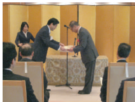
第1回表彰式（平成21年2月5日）から

※平成21年度の日程等詳細については、決まり次第、京都府ホームページなどで、ご紹介させていただきます。