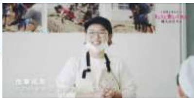
舞鶴佐波賀だいこんの授業（小学校）

きょうと食いく先生の授業の様子や、関係者へのインタビュー動画をYouTubeに掲載しています。