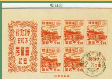
▲戦後最初の京都切手展小型シート(清水寺)