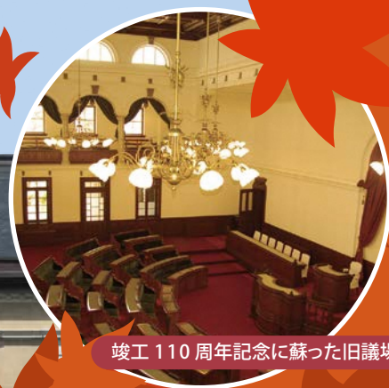
竣工110周年記念に蘇った旧議場