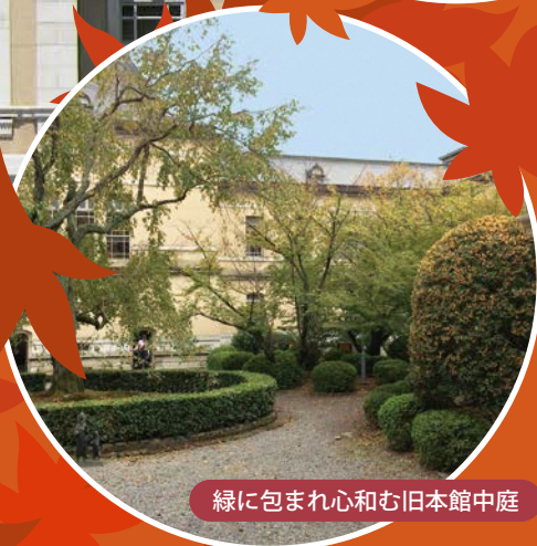
緑に包まれ心とむ旧本館中庭