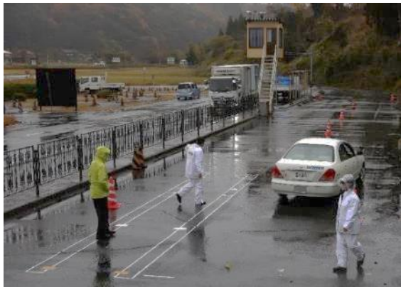
スラローム走行訓練