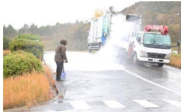
人工降雪機による積雪路の再現