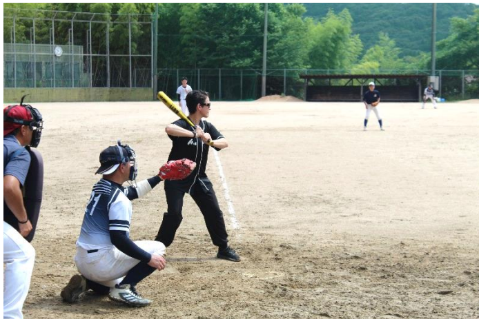
盆野球 (令和7年8月13日(水))