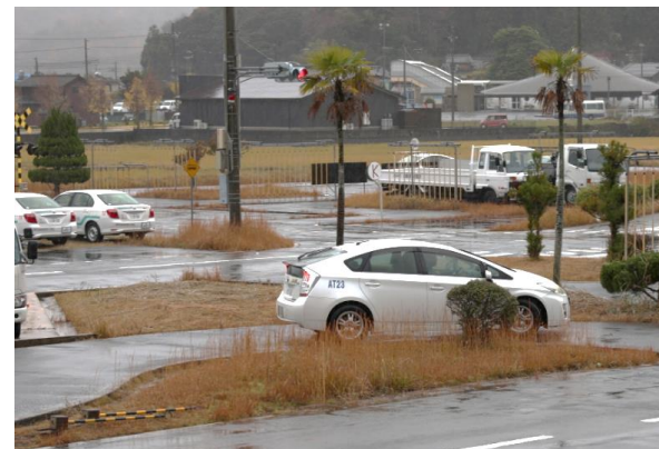
教習所内コース走行訓練