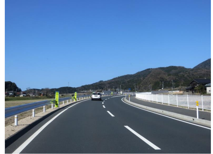
間人大宮線（大門橋）