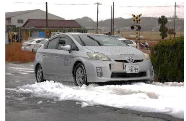
積雪路(坂道)の走行訓練