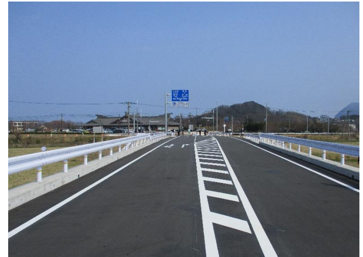
浜丹後線（宮バイパス）