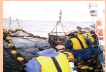
1人乗り以外の漁船で漁業を行っている者

船室内に乗船している者や潜水漁業を行うために必要な措置（ウェットスーツ着用等）を講じている者等は、ライフジャケットの着用義務を負いません。