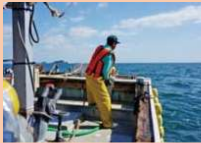
1人乗り漁船で漁業を行っている者