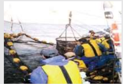
1人乗り以外の漁船で漁業を行っている者