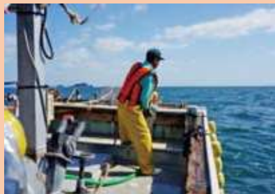
1人乗り漁船で漁業を行っている者