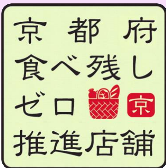
食品小売店版ステッカー