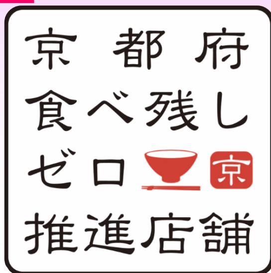
飲食店・宿泊施設版ステッカー