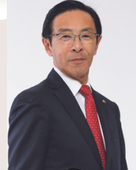
京都府知事 西脇 隆俊