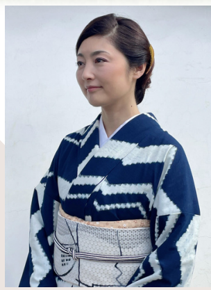
京都府文化観光大使 俳優 常盤 貴子氏