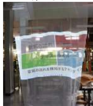
揺れ動きに応じて映像が変化する様子及び動画のQRコード