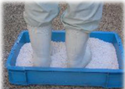
消石灰を使った踏み込み消毒槽

<目的> 鶏舎に入る前に靴底消毒をし、鶏舎内に病原体を持ち込まないようにするため <方法> プラスチックコンテナ等に消毒液(逆性石けんや消石灰等)を入れ、鶏舎出入口に設置し、鶏舎に入る前に長靴を浸して消毒します。 ※ 消毒液は汚れたらこまめに取り換えましょう。(汚れていると消毒効果が弱まります)