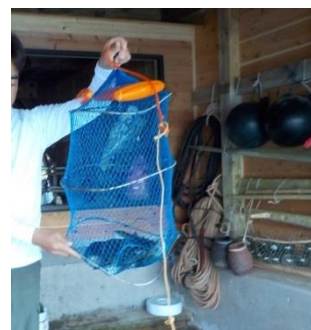
もんどり体験の様子