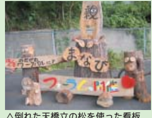
△倒れた天橋立の松を使った看板

子どもが生きる力をはぐくむ基盤となる家庭の教育力を高めるために、親同士が子育ての課題解決に向けて共に学び合い、地域社会全体で取り組む「子育て」と「親育ち」について研修を深める場として実施しました。