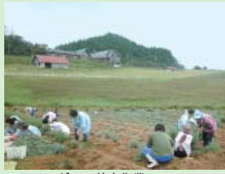
△ラベンダーの剪定作業

『憩いの牧場』づくりの一環として本年5月に約500本のラベンダーの試験植栽を行いました。植栽からその後の管理は「海に見えるラベンダー畑の会」等の地元住民との協働により実施しています。