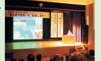
△11月11日に開催した第2回のフォーラム

京都モデルフォレストの推進に向けて、地域一丸となった『継続的な森づくり』を目指すため、昨年に引き続き第2回丹後里山整備・保全フォーラム(テーマ:「森とのつきあい方」提案します)を開催しました。