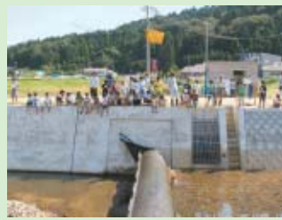
△中井根井堰での学習

平成15年度から改修してきた中井根井堰(京丹後市久美浜町神谷地内)が平成18年7月に完成しました。