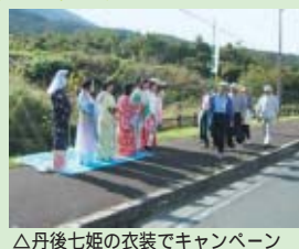
△丹後七姫の衣装でキャンペーン

きょうと健やか21推進丹後地域府民会議では、丹後の健康づくり事業として、ウォーキングキャンペーンを実施しました。