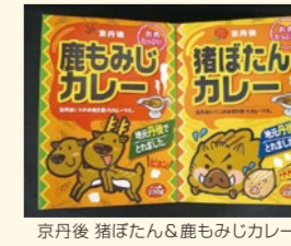
京丹後 猪たん＆鹿もみじカレー

はがきにクロスワードパズルの答えと郵便番号、住所、氏名、電話番号を記入し、〒627-8570(住所不要) 丹後広域振興局 企画振興室 クイース係へ。二桁の丹後「ユース」への思い見ご感想も書き添えてください。締め切りは10月31日(月)必着。正解者の中から抽選で10人の方に「京丹後猪たん＆鹿もみじカレー」(各2個、計4個のセット)をプレゼントします。なお、当選者の発表は、商品の発送もさせていただきます。お申し込みは、お申し込みの発行をさせていただきます。お申し込みは、お申し込みの発行をさせていただきます。