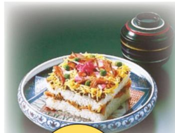
丹後といえば「ばらすし」