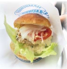
丹後のご当地バーガー