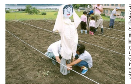
そばを野生鳥獣から守ります

問 府立丹後郷土資料館 ☎ 0772-27-0230 FAX 0772-27-0020