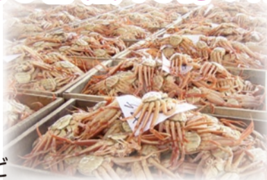
当日解禁のカニ(写真はコッペ)