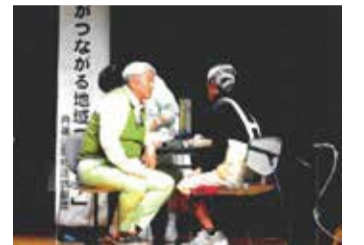
かかりつけ医に相談する様子を伝える劇

問 丹後保健所企画調整室 ☎0772-62-0361 ☎0772-62-4368