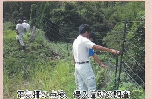
電気柵の点検、侵入箇所調査

普及センターでは、関係機関と一体となって、より効果的対策がとれるよう支援を行っています。