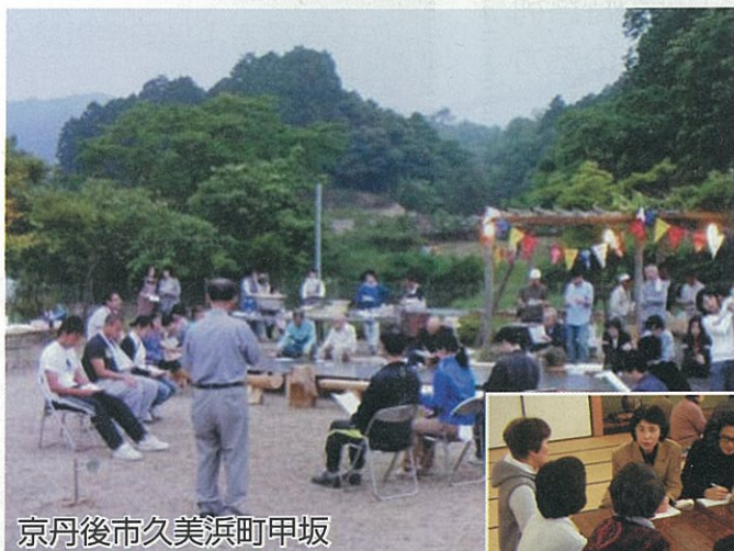
京丹後市久美浜町甲坂