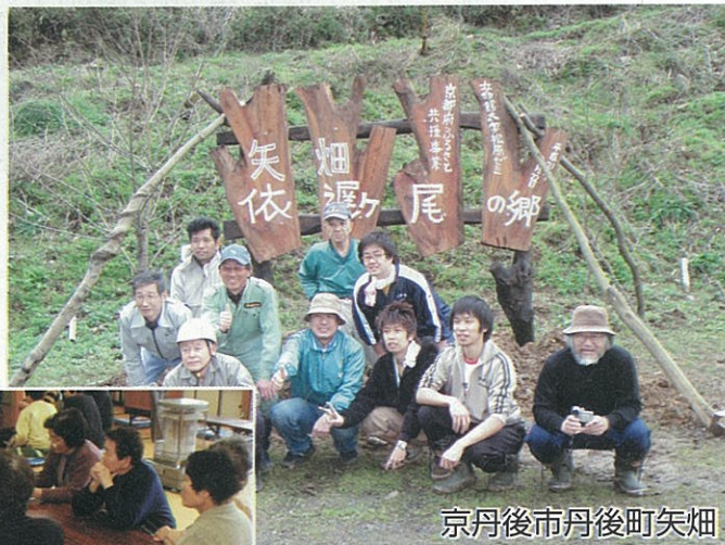
京丹後市丹後町矢畑