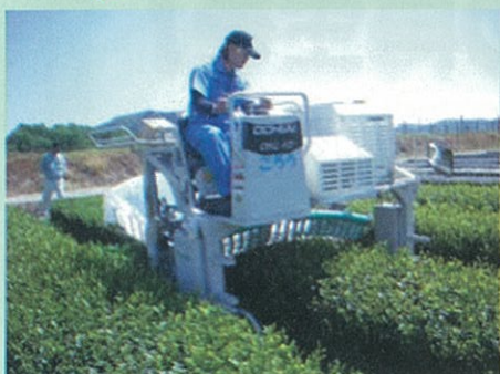
乗用型機械で茶摘みを省力的かつ精度良く行います