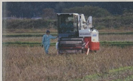
汎用コンバインによる収穫