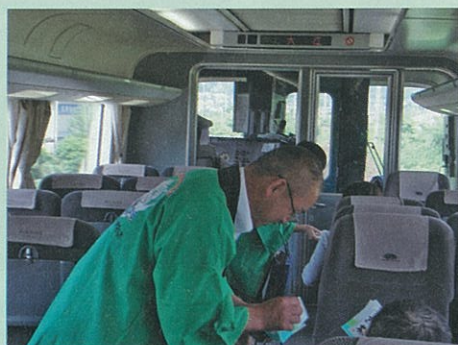
車内で新茶の小袋をプレゼント