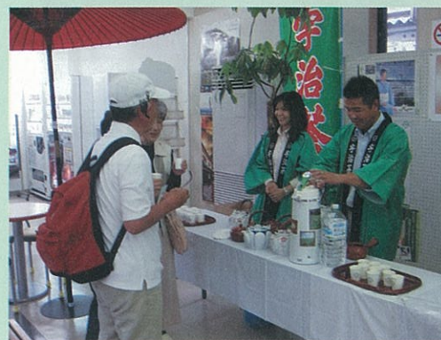
天橋立駅で、お茶の試飲

来年からの本格出荷を前に、茶関係者だけでなく消費者の皆さんにも丹後の茶を知っていただくため、PRを行いました。