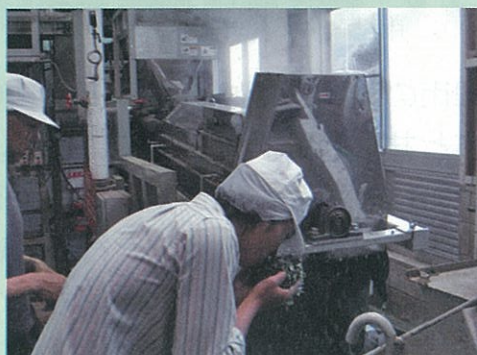
伝統的な宇治茶の製法を学び、茶の持つ香りや色を十分に引き出します