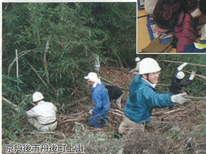
京丹後市丹後町上山