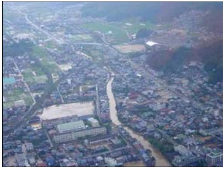
平成16年 台風23号被災状況 (2,400戸を超える大規模な浸水被害)