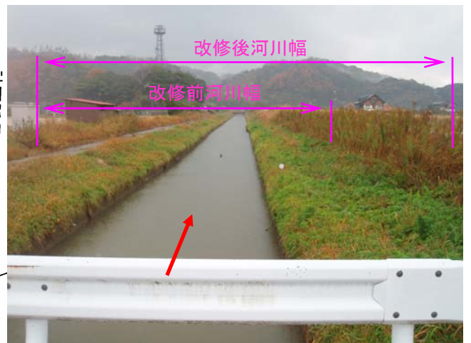
支川新庄川の野島橋から下流側 河道拡幅により治水安全度の向上を図ります