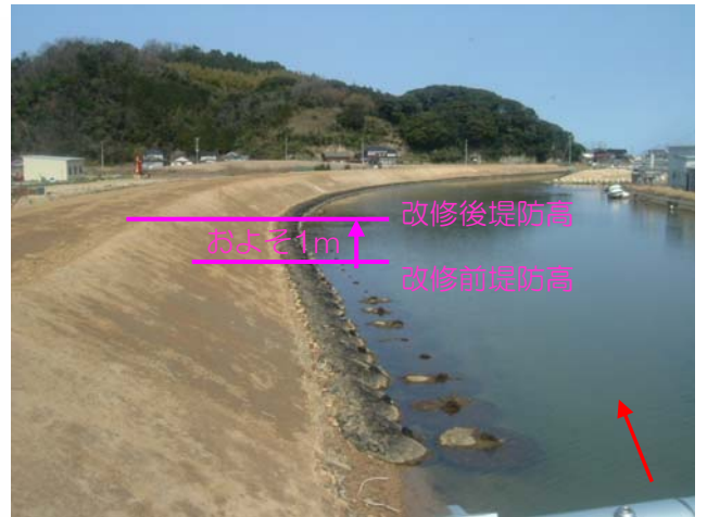
弁天大橋下流側 H18年度福田川左岸築堤盛土を施工