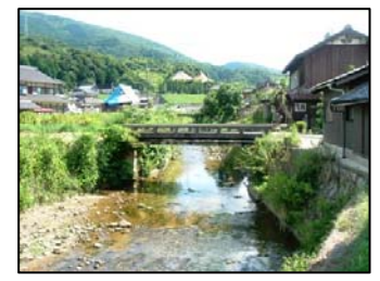
新中橋下流護岸工事 藤照工業 工事着手に向けて準備をしています。