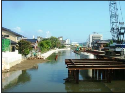
中橋架け替え工事 鶴美・永田JV 橋脚が完成しました！