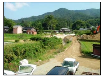
中島橋架け替え工事 河嶋建設 工事着手に向けて準備をしています。