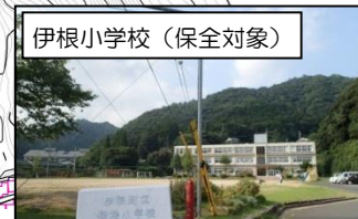
伊根小学校（保全対象）