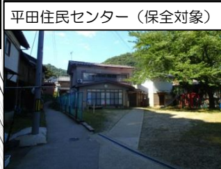
平田住民センター（保全対象）