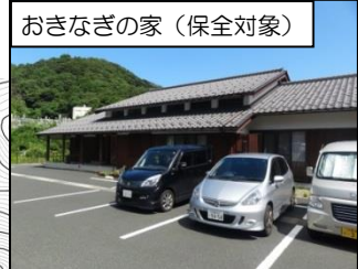
おきなぎの家（保全対象）