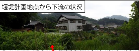
堰堤計画地点から下流の状況