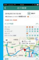
安全運転のヒント