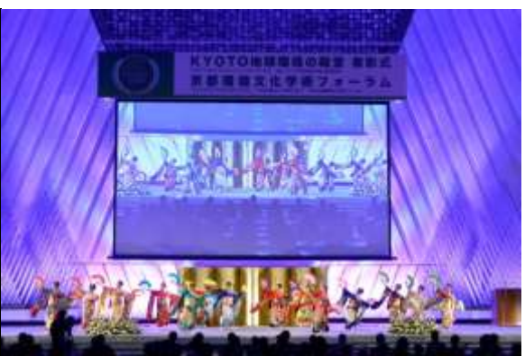
(第8回) 京都聖母学院小学校合唱団