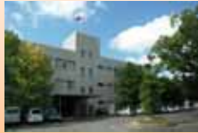
京都府農林水産技術センター

農林水産技術センターの 工場見学の後いよいよ収穫 体験。賀茂なす、もぎ茄子 など京野菜の代表格を実際 に採ってみよう！