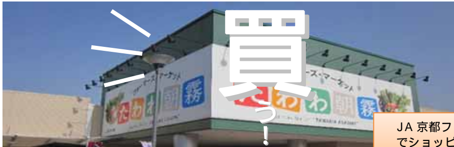
JA 京都ファーマーズマーケット「たわわ朝霧」