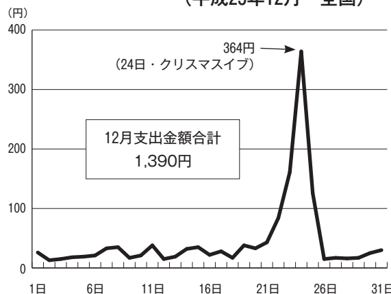
図3 1世帯あたりのケーキの日別支出金額（平成25年12月 全国）