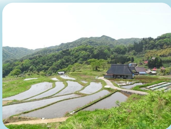
京都府景観資産登録第13号 棚田と笹葺き民家が織りなす上世屋の里山景観