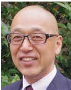
第一三共株式会社 常務執行役員 研究開発本部長