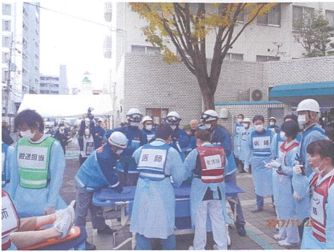
2車両内の負傷者を田辺中央病院に搬送