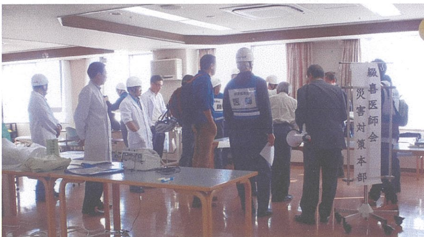
綴喜医師会災害対策本部