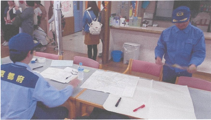
山城災害対策支部（田辺副支部）