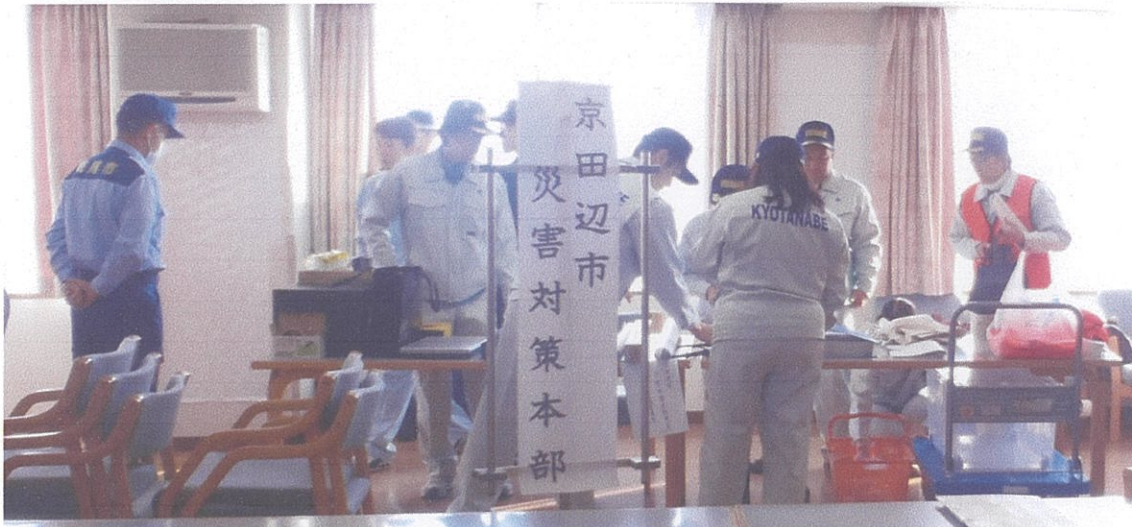
京田辺市災害対策本部