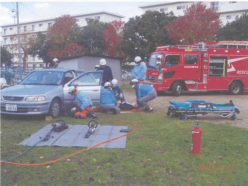
車の下敷きになった重症者を救出中