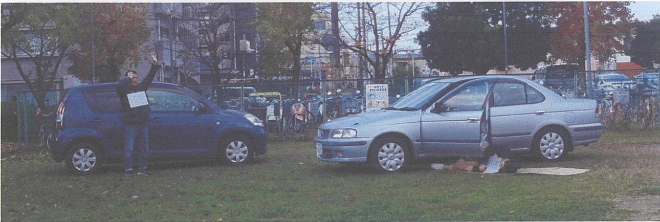
助けを求める軽傷者、車からはじきとばされた重症者