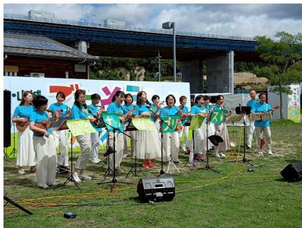
(参考写真) 前回ステージの様子