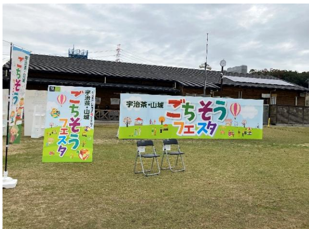
(参考写真) ステージのイメージ