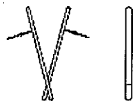
アリゲーター運動