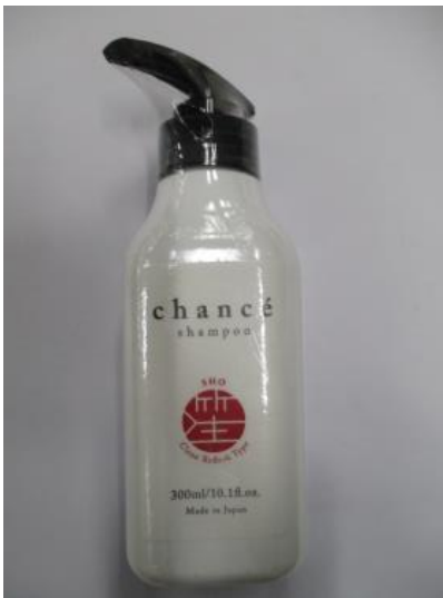
(13) シャンセ シャンプー 紗