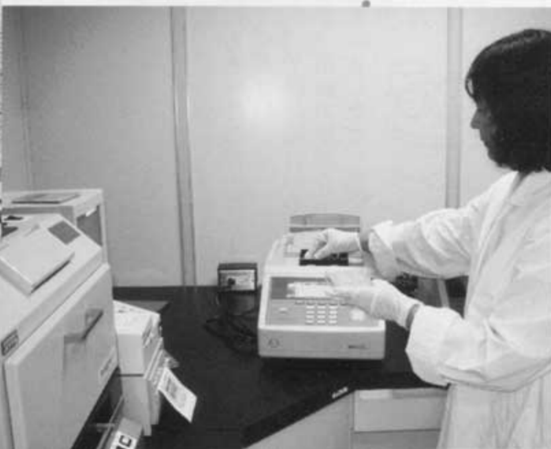
サーマルサイクラー装置によるPCR(遺伝子)検査