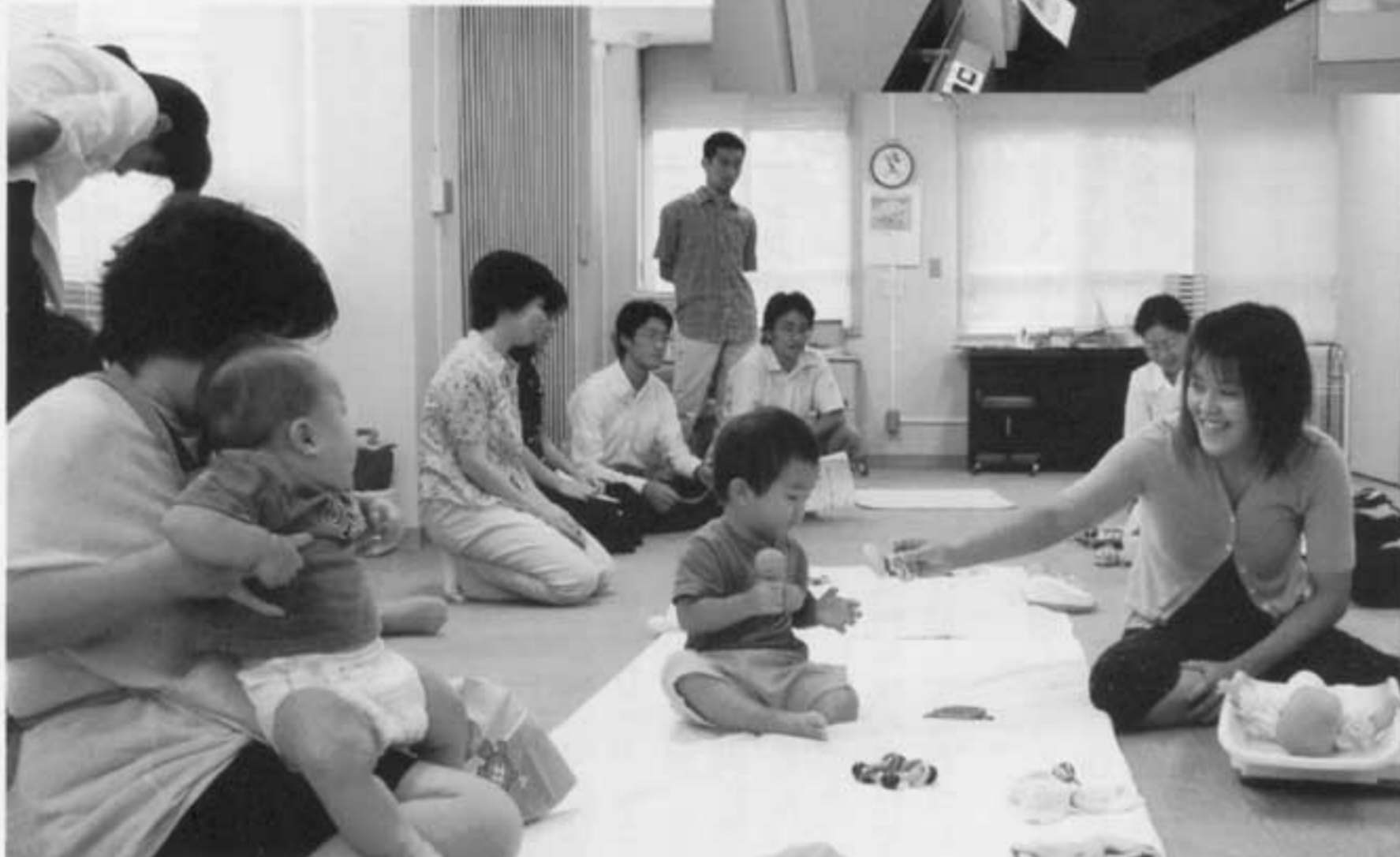
専門職員による赤ちゃんの心配ごと相談や育児アドバイスを実施しています。