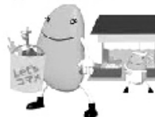
コマメにマイバッグを持ち歩きましょう!

京都府では、10月を「マイバッグ・キャンペーン月間」とし、事業者などと連携して消費者の方々へマイバッグ持参によるレジ袋削減を呼びかけています。