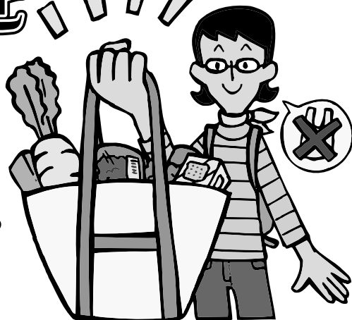
PRキャラクター コマメちゃん（環境省）