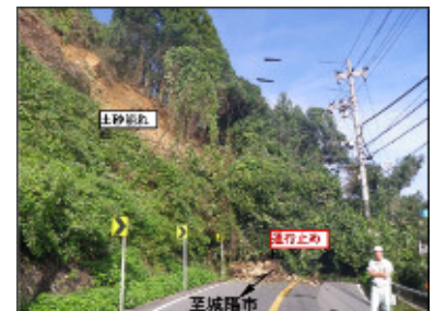
【被災の様子 平成25年9月】