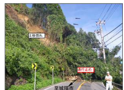
【被災の様子 平成25年9月】