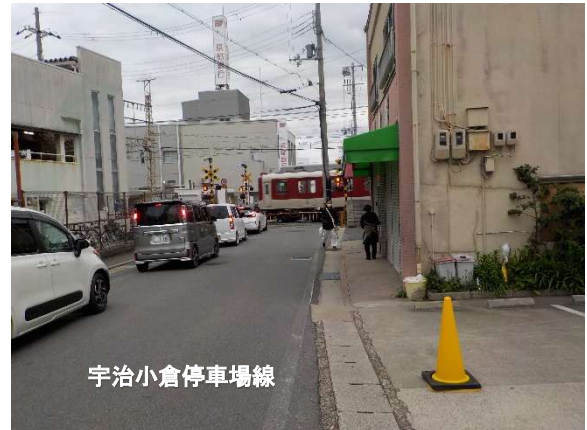
(向島第5号踏切付近)