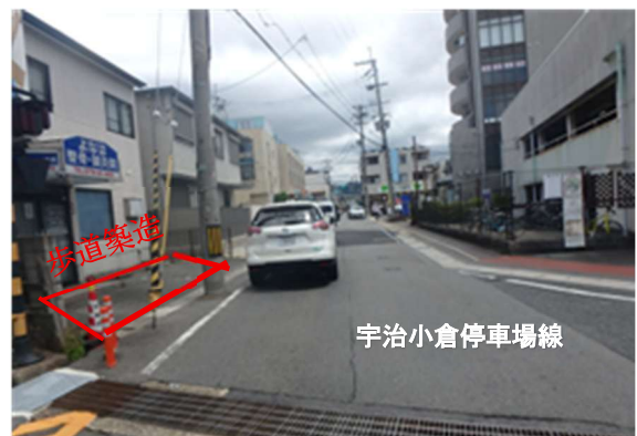
(向島第5号踏切から)