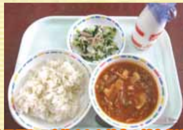
宇治田原町で実施された給食の献立(H24.6)