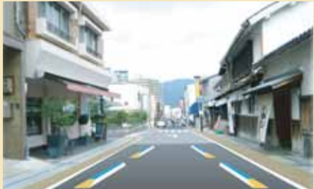
完成後の宇治橋通り

問 山城北土木事務所 道路計画室 TEL: 0774-62-0528 FAX: 0774-65-2649