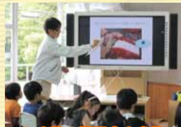
みず菜の学習会を実施