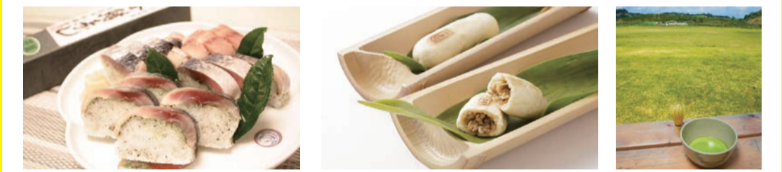
茶薫餅(チャカラルサバズシ)