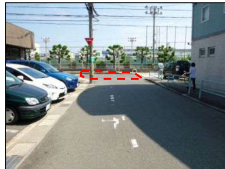
市道側から交差点を撮影