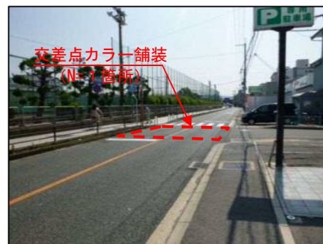
府道西側から撮影