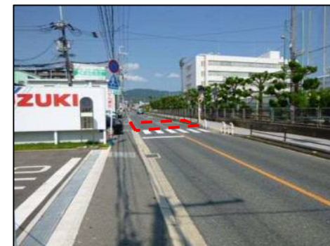
府道東側から撮影