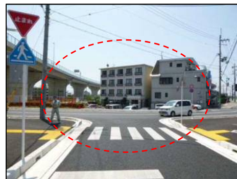
西側から撮影(昼間) (奥海印寺納所線)