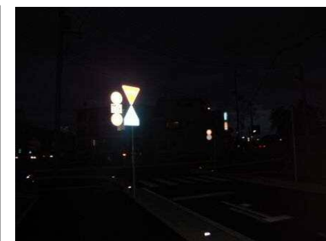
西側から撮影(夜間) (奥海印寺納所線)