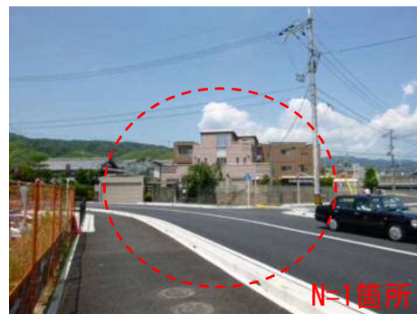
東側から撮影 (大山崎大枝線)