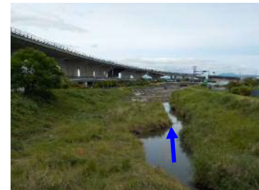
<起点八丁南橋より下流側>