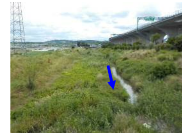
<中間点内里橋より上流側>