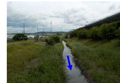
<起点八丁南橋より上側流>