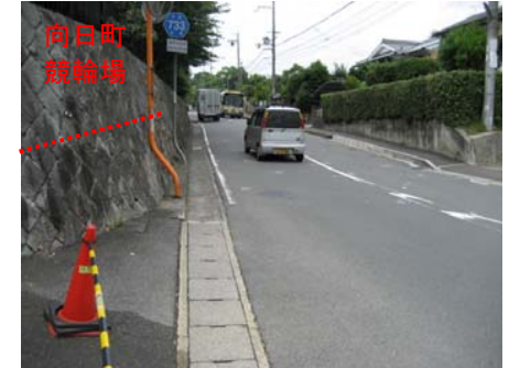
<西側から東側を望む>