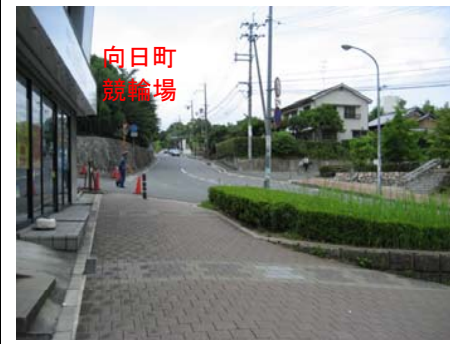
<東側から西側を望む>